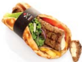
Μπιφτέκι γεμιστό με 3 τυριά