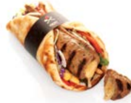
Μπιφτέκι γεμιστό με καπνιστό κασέρι