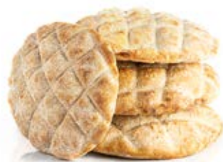
Ζυμωτό ψωμάκι για σάντουιτς

Όταν η παράδοση συναντά την καινοτομία σε έναν νόστιμο συνδυασμό Street Food