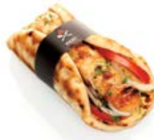
Χειροποίητο σουβλάκι κοτόπουλο