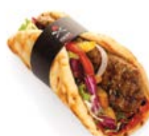
Μπιφτέκι Ελληνικό Στικ EL