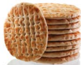
Κλασική ελληνική πίτα