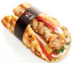
Χειροποίητο σουβλάκι χοιρινός