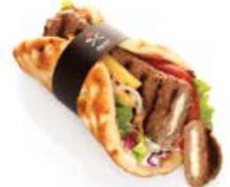
Μπιφτέκι γεμιστό με Edam