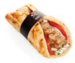
Σουβλάκι χοιρινός μηχανής