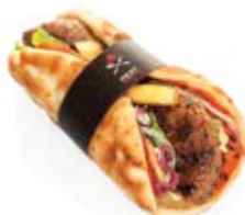
Μπιφτέκι Ελληνικό EL