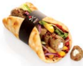
Σουτζουκάκι γεμιστό με κρέμα τυριού